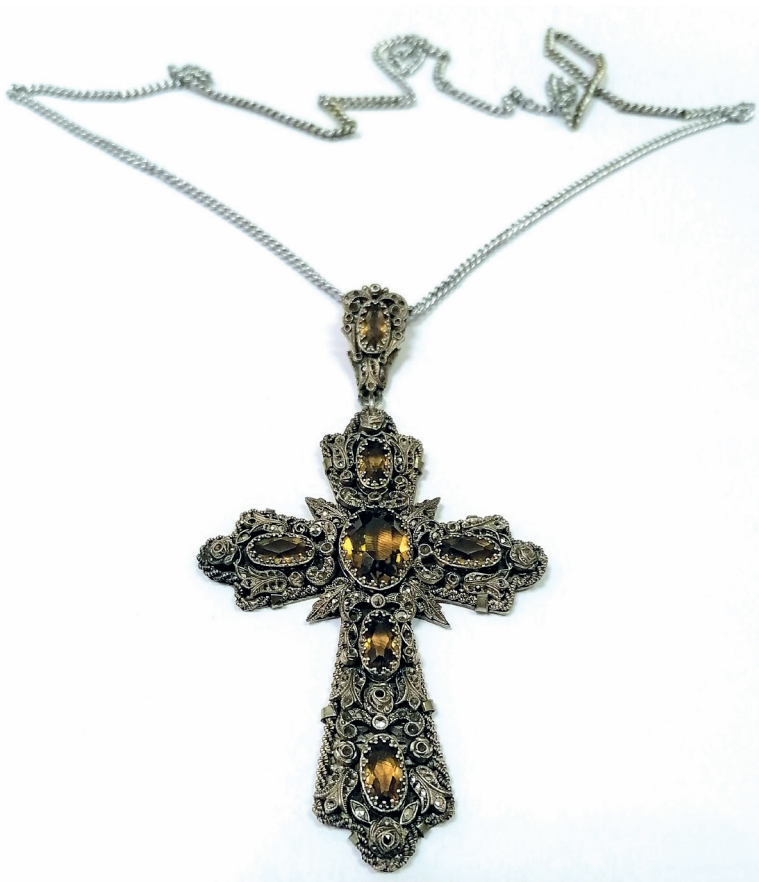
Figure 4. Pectoral Cross of Bishop Nicholai from Vojlovica Monastery | Сл. 4. Напрсни крст Епископа Николаја из манастира Војловица