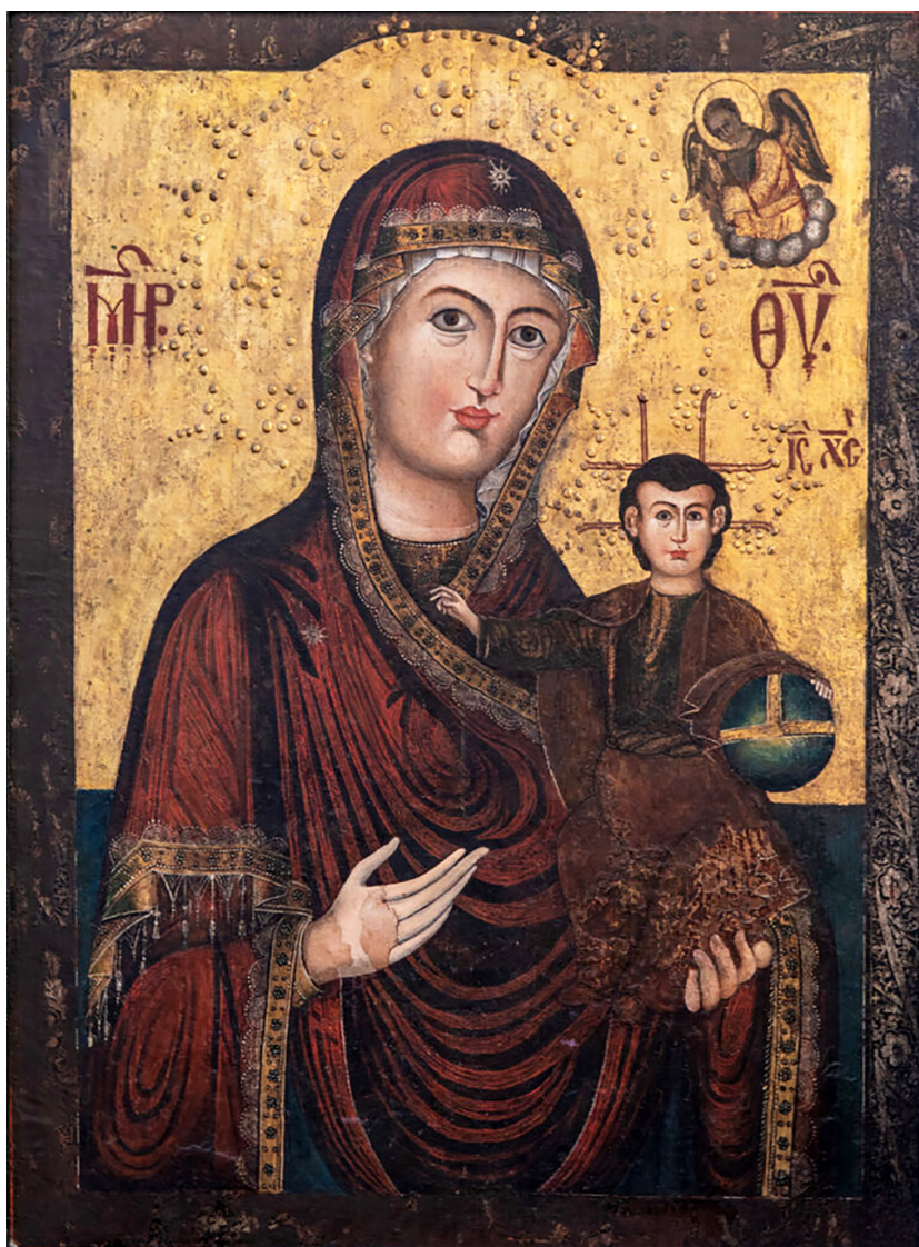
Figure 1. Icon of the Most Holy Theotokos Slovesnica | Сл. 1. Пресвета Богородица Словесница