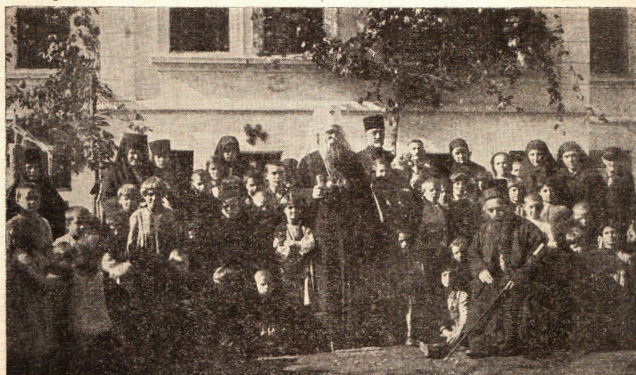
Блаженочивши патријарх Варнава међу децом у Хранилишту „Богдај“ 1936 године Прилоге слати на адресу Хранилишта: Битољ, Сарајевска улица број 43.

Fig. 1. Patriarch Varnava Rosić and Bishop Nikolai Velimirovich visit the Bogdaj orphanage in 1936